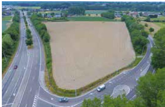
Locatie van de nieuwe brandweerkazerne aan Linnerbocht

B egin juli ging de Bilzerse gemeenteraad akkoord met de bouw van de nieuwe kazerne aan de Linnerbocht. De stad koopt hiervoor de nodige gronden aan om ze vervolgens aan de brandweerzone te geven. De keuze voor de site ligt voor de hand. De maximumcapaciteit van het huidige gebouw aan het Begijnhof is bereikt en de ligging in het centrum maakt vlot uitrukken niet altijd even evident.